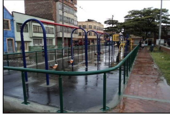
Parque san Bernardo después de intervención