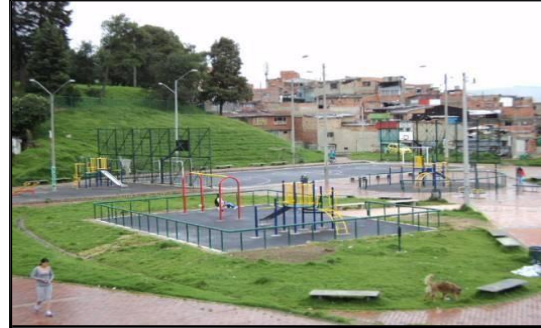
Parque de Lourdes Izquierdo antes de intervención Parque de Lourdes Izquierdo después de intervención

Con respecto a la disposición de las barandas desmontadas, éstas se entregaron a la JAC mediante actas de reunión, las cuales se adjuntan al presente documento (se anexan 5 folios).