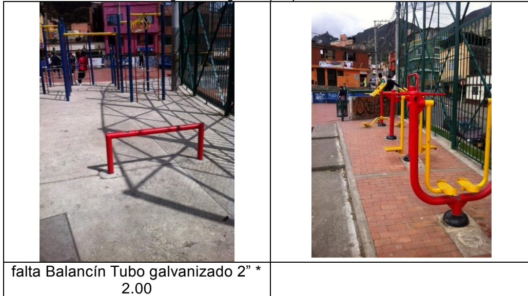
Imagen 4. Registro fotográfico parque El Consuelo

“Por un control fiscal efectivo y transparente”