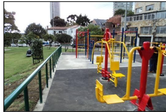
Parque Bosque Izquierdo después de intervención

En el Parque Lourdes se aclara que la zona donde se instaló la baranda, fue construcción nueva y al momento de la intervención no existía baranda en el sector de los juegos tipo 3A y 5A. Tal como se evidencia en el registro fotográfico del antes y después de la obra. La baranda que actualmente existe, en el sector mencionado, fue colocada en su totalidad mediante este contrato.