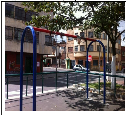
Imagen 3 Registro fotográfico parque San Bernardo

Los ítems 10849 “Desmote y reinstalación juegos infantiles tipo M-5 o 5 (columpios) e ítem 10568 Suministro e Instalación juegos Infantiles módulo 5 A Columpios dos Puestos” corresponden a la instalación y reinstalación del mismo producto.