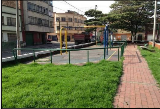
Parque san Bernardo antes de intervención

necesario cambiar las barandas porque, de una parte la longitud de las barandas anteriores a la intervención no cubría la nueva área intervenida y su estado de deterioro evidenciaba oxidación y fatiga del material, lo que implicaba fallas al momento de la soldadura.