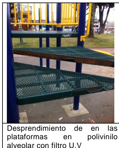
Imagen 2. Registro fotográfico parque de las Cruces.

Los juegos infantiles, módulo identificado 3 A, presentan desprendimiento en las plataformas, dado el deterioro del polivinilo alveolar con filtro U.V a causa de vandalismo, evento que hace necesario realizar el arreglo correspondiente, dado que de no realizarse mantenimiento correctivo se puede ver afectado el módulo en su totalidad (ver imagen siguiente).