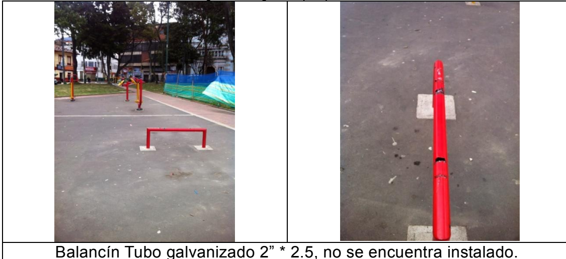
Imagen 1. Registro fotográfico parque de las Cruces

Los juegos infantiles, módulo identificado 3 A, presentan desprendimiento en las plataformas, dado el deterioro del polivinilo alveolar con filtro U.V a causa de vandalismo, evento que hace necesario realizar el arreglo correspondiente, dado que de no realizarse mantenimiento correctivo se puede ver afectado el módulo en su totalidad (ver imagen siguiente).